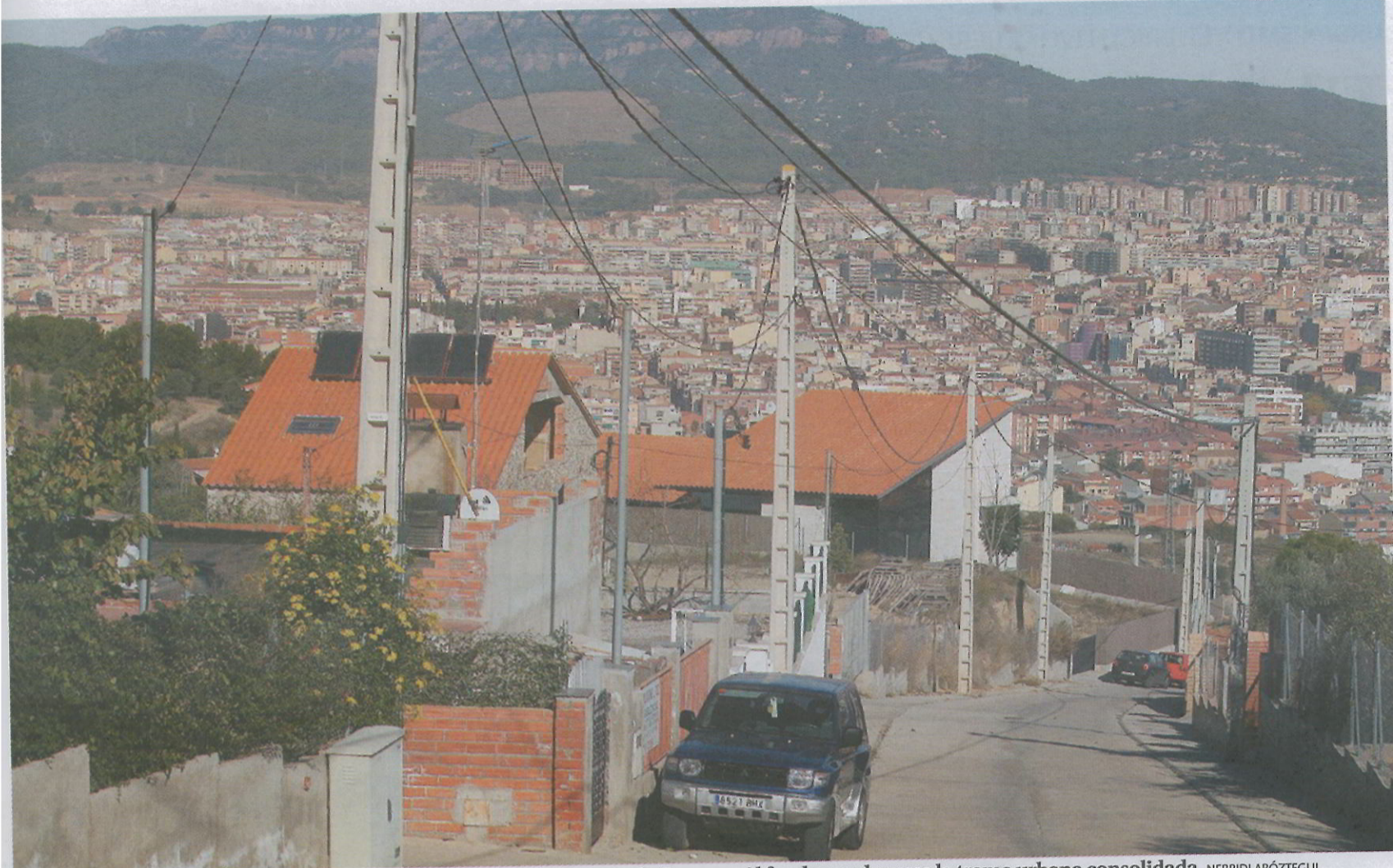
Les Martines y Les Carbonelles están situados en el extremo suroeste de Terrassa. Al fondo puede verse la trama urbana consolidada. NEBRIDI ARÓZTEGUI

URBANISMO &gt; IMPULSO DEFINITIVO A UNA URBANIZACIÓN QUE EMPEZARON EN 2002 Y SE INTERRUMPIÓ EN 2004 POR MALA EJECUCIÓN